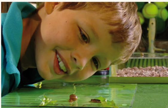
A oficina de Tord - NRK - Noruega